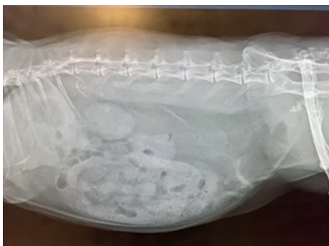
Billede 2 – Svend efter skylning.