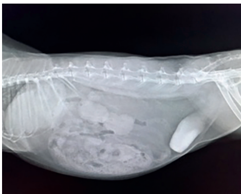
Billede 1 – Svend før skylning.

På billedet ses en overvægtig kastreteret hankanin med sludge i blæren (billede 1). På trods af at han lever som fri-kanin i hjemmet, har forkert fodring gjort ham overvægtig og inaktiv. I narkose blev der