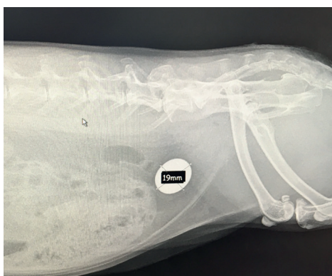
Kanin med blæresten.

Kaniners calciummetabolisme adskiller sig dramatisk fra hunde og kattes (se tidligere artikel om urinvejslidelser hos kaniner). Overskydende calcium udskilles gennem