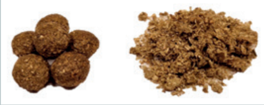
Flotte afføringskugler der afslører fibre når de smuldrer

Kaniners afføringskugler skal være store, lyse, og have en tekstur, der minder om små stykker hør, når de smuldrer mellem fingrene. Kaninens natafføring (caecotrofer) er klistrede, mørke, ildelugtende og minder om en lille drueklase såfremt kaninen ikke har trådt på dem. Kaninen skal spise al sin natafføring, da den indeholder kilden til proteiner, vitaminer og enzymer. Oplever du, at kaninens afføring bliver mørkere og mindre eller begynder du at finde natafføring i bakken eller siddende fast i pelsen, bør kaninen tilses af en dyrlæge med det samme.