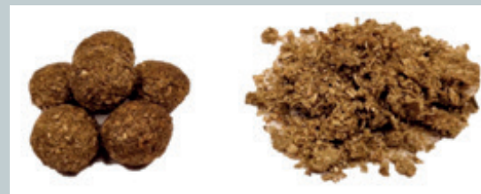
Flotte afføringskugler der afslører fibre når de smuldrer

Kaniners afføringskugler skal være store, lyse, og have en tekstur, der minder om små stykker hør, når de smuldrer mellem fingrene. Kaninens natafføring (caecotrofer) er klistrede, mørke, ildelugtende og minder om en lille drueklase såfremt kaninen ikke har trådt på dem. Kaninen skal spise al sin natafføring, da den indeholder kilden til proteiner, vitaminer og enzymer. Oplever du, at kaninens afføring bliver mørkere og mindre eller begynder du at finde natafføring i bakken eller siddende fast i pelsen, bør kaninen tilses af en dyrlæge med det samme.